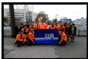
～無保険車撲滅・追放キャンペーン～